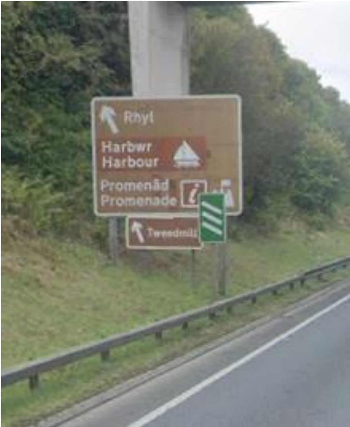
Image of existing Rhyl Key Brown Tourism Sign on A55 Westbound Carriageway at Junction 27